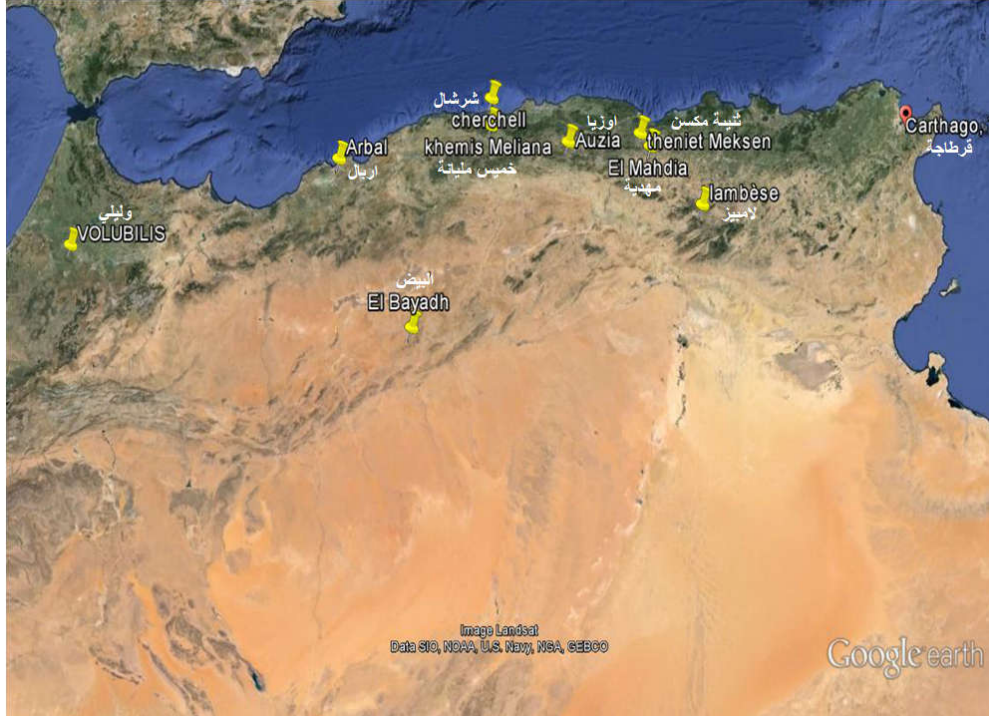
المناطق التي عرفت تواجد قبائل البوار (حسب النقوش)

فهذه الثورات هي نتيجة التوسع الروماني الذي نتج عنه تصدي محلي لم يستطع الرومان إخماده لا بالقوة، ولا بالدبلوماسية مثل ما أشارت إليه النقوش عندما تحدثت عن معاهدة بين الحاكم الروماني وملوك البوار، مما يؤكد مرة أخرى ان روما تفاوضت مع أشخاص ذوي قوة وسيادة، وان النظام السياسي الروماني خاصة في الفترة المتأخرة لم يعد قادرا على ضمان مصالح السكان الرومانيين من أصول محلية، الذين كانوا يبحثون دوما عن حل وسط مع القوى السياسية الجديدة التي جاءت بعد روما.